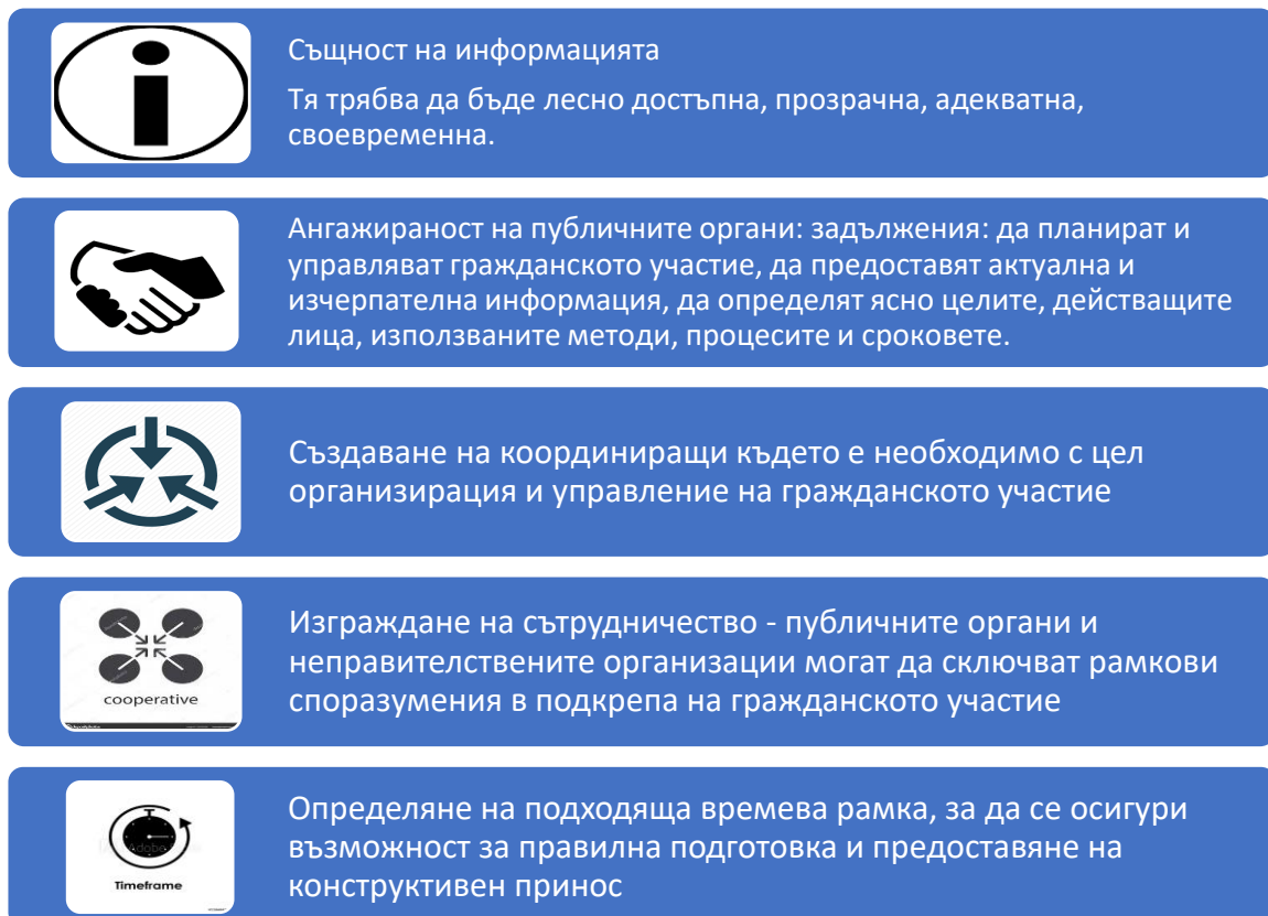
Схема 1. Основи за участие на гражданското общество в процеса на вземане на политически решения

Схема 1 представя възможностите за участие на гражданите във взимането на политически решения.